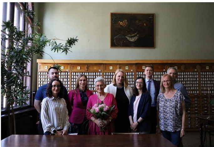
Zespół ds. Standardów dla Bibliotek Naukowych

3 czerwca 2022 r. odbyło się spotkanie Zespołu ds. Standardów dla Bibliotek Naukowych, podczas którego pracowano nad aktualizacją Porozumienia o współpracy pomiędzy uczelniami współpracującymi w projekcie na okres 2023-2028. Dyskutowano także o zmianach, które należy wprowadzić do formularzy AFBN (w nawiązaniu do uwag zgłoszonych podczas warsztatów) oraz planowanych działaniach na przyszłość: narzędziu do wizualizacji danych, kolejnych warsztatach.