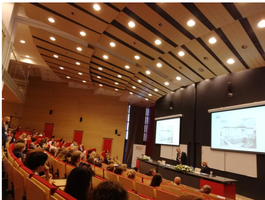
Biblioteka AGH

W dniach 12-13 września 2019, w Bibliotece Głównej Akademii Górniczo-Hutniczej w Krakowie, odbyła się konferencja pod tytułem „Biblioteki uczelniane wobec środowiska akademickiego – nowe obszary działania”. Podczas konferencji poruszane były tematy dotyczące funkcjonowania nowoczesnej biblioteki akademickiej, omawiano zadania postawione przed bibliotekarzami pracującymi w tych instytucjach, jak m.in. prowadzenie repozytoriów instytucjonalnych. Wystąpienia dotyczyły również narzędzi niezbędnych w codziennej pracy bibliotekarza naukowego - służących do gromadzenia i zarządzania informacjami o osiągnięciach naukowych.