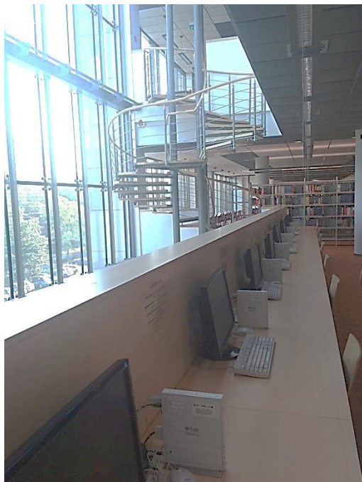
Biblioteka Główna Uniwersytetu Ekonomicznego