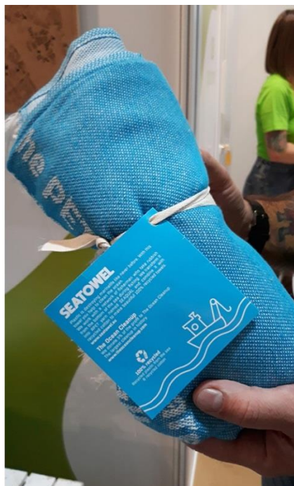
Notes z papieru czerpanego z odchodów słonia i ręcznik z recyklingu plastikowych butelek wyławianych z oceanu - Festiwal Marketingu i Druku