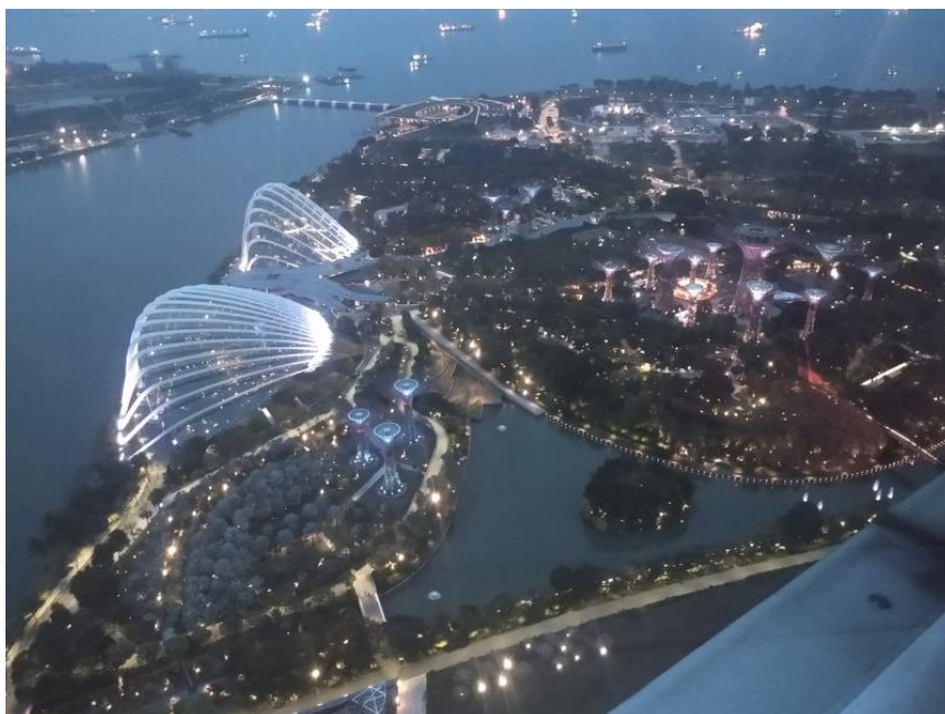
Singapur, Gardens by the Bay

W dniach 27 - 29 sierpnia 2018 w Singapurze odbyła się 14. międzynarodowa konferencja użytkowników produktów firmy ExLibris - IGELU 2019 (International Group of ExLibris Users). W wydarzeniu udział wzięło 302 uczestników z 33 krajów z całego świata. Program konferencji liczył niespełna 100 wystąpień.