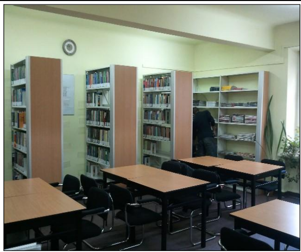
Biblioteka w D.S. Akademik.